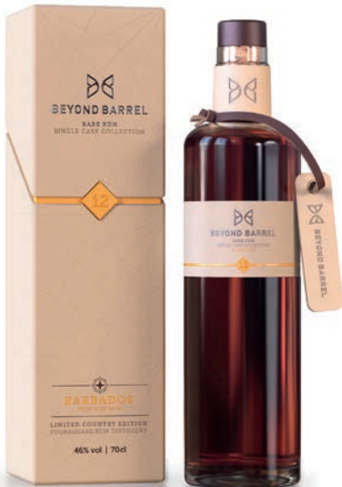
BARBADOS RUM / 12 Y. LIMITED COUNTRY EDITION Foursquare Rum Distillery