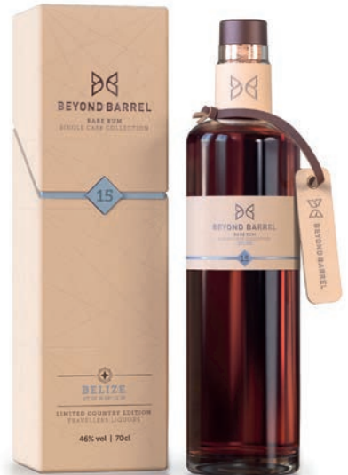
BELIZE RUM / 15 Y. LIMITED COUNTRY EDITION Travellers Liquors